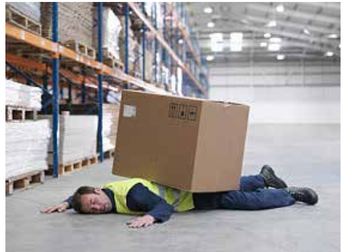
Työtaturma voi olla hengenvaarallinen.

Tutkimushanke toteutettiin Tampereen yliopiston, Tapaturmavakuutuskeskuksen ja Eläketurvakeskuksen yhteistyönä.