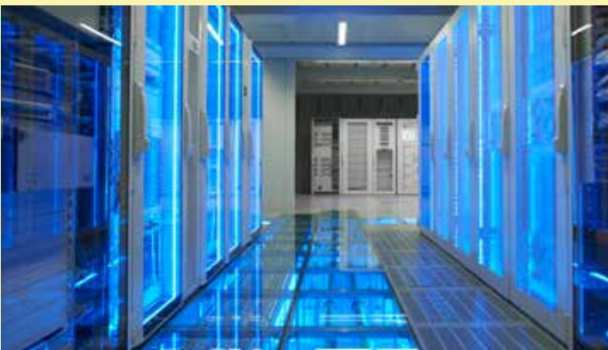
Kuva on viitteellinen.

Pilvipalveluiden ja esineiden internetin yleistyessä palvelinsalien melu häittää usein jo työntekoa.