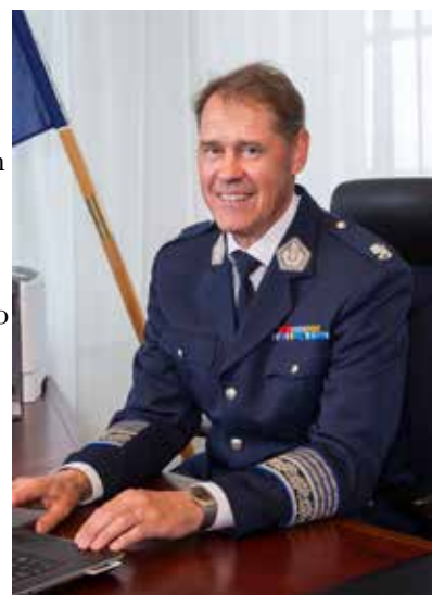
Polisiyllyjohtaja Seppo Kolehmainen.

Kolehmainen muistuttaa, että poliisi seuraa tilannetta ja puuttuu mahdolliseen lainvastaiseen toimintaan.