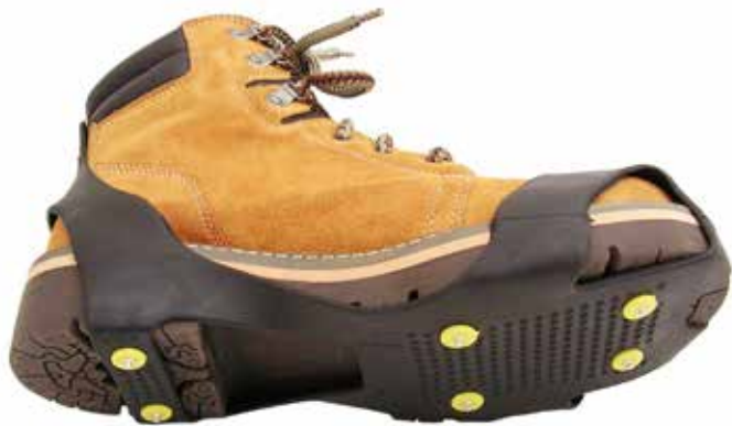
Liukuesteet ovat tehokkaita jäisillä talvikeleillä.

Maksettujen korvausten perusteella vakavimmat vapaa-ajan tapaturmat osuvat joulumaaliskuun väliin, ja tapaturmapiikki osuu erityisesti lauantaihin. Tämä ilmenee LähiTapiolan vapaaehtoisen tapaturmavakuutuksen vahinkotilastoista.