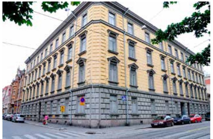
Suojelupoliisin pääkonttori sijaitsee Helsingin Ratakadulla.

Muutos perustuu Poliisihallituksen määräykseen. Turvallisuusselvityslakiin pyritään tekemään myöhemmin tarvittavat muutokset ja tarkennukset toimivaltaisista viranomaisista.