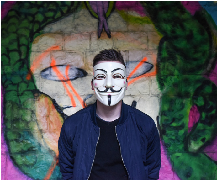
Millainen profiili paljastuu venäjää puhuvan kyberrikollisen naamarin alta? Sivut 30–32