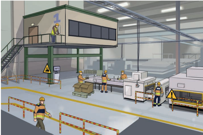
Turvallisuuskulttuurin kehittäminen vaatii jatkuvaa ja imostavaa työturvallisuuskoulutusta. Sivut 52–54