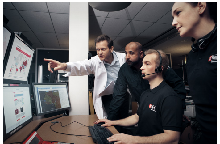
Työmatkoja ulkomaille tekevien ei tarvitse turhaan pelätä, sillä tarjolla on monipuolisia turvallisuuspalveluita. Sivut 48–50

Pääkirjoitus ..... 3 Uutiset ..... 12 Yhdistykset ..... 60